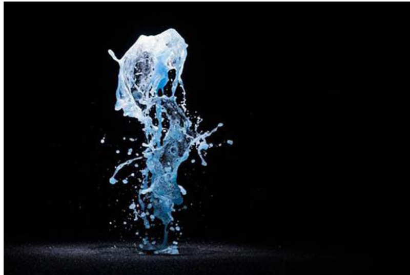
Big bang fountain, Olafur Eliasson

Usted podría decir que se trata solo de respuestas parciales. La cultura es una presencia fundamentalmente desordenada en todos los ámbitos de la sociedad y, por supuesto, con sus propios sesgos, inequidades sistémicas y complejidades. Pero el hecho de ser desordenada no reduce su función de apoyarnos e inspirarnos; es, de hecho, una forma de poder. Artistas, bailarinas, músicos, cineastas y escritores tienen la capacidad de reflejar situaciones, aspiraciones y sentimientos de gente y comunidades marginales u olvidadas. Crean espacios culturales con diferencias y conflictos que abrazan puntos de vista contenciosos y ofrecen plataformas para discusiones difíciles. Prevén nuevas narrativas y modos de ser y de convivir.