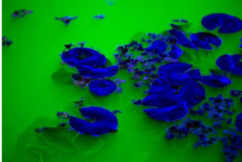
Detail of life , Olafur Eliasson

Ice Watch , un trabajo artístico que realicé con el geólogo Minik Rosing, en tres ocasiones en el espacio público, fue una invitación a que los transeúntes se involucraran con grandes bloques de agua vieja y congelada que se derretían gradualmente, mientras escuchaban el ruido del deshielo –que liberaba aire de miles de años–, tocaban y olían el hielo derretido.