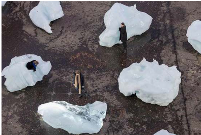
Ice Watch , Olafur Eliasson

Veo una conexión entre utilizar nuestro propio cuerpo en formas tradicionales de activismo y el arte. Al utilizar el cuerpo para resistir y responder a la violencia, a la injusticia social y a la explotación económica, los protestantes literalmente encarnan sus causas.