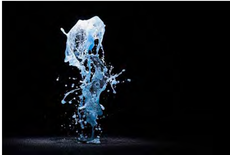
Big bang fountain, Olafur Eliasson

Usted podría decir que se trata solo de respuestas parciales. La cultura es una presencia fundamentalmente desordenada en todos los ámbitos de la sociedad y, por supuesto, con sus propios sesgos, inequidades sistémicas y complejidades. Pero el hecho de ser desordenada no reduce su función de apoyarnos e inspirarnos; es, de hecho, una forma de poder. Artistas, bailarinas, músicos, cineastas y escritores tienen la capacidad de reflejar situaciones, aspiraciones y sentimientos de gente y comunidades marginales u olvidadas. Crean espacios culturales con diferencias y conflictos que abrazan puntos de vista contenciosos y ofrecen plataformas para discusiones difíciles. Prevén nuevas narrativas y modos de ser y de convivir.