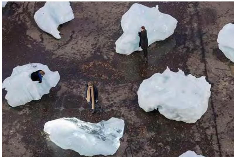
Ice Watch , Olafur Eliasson

Veo una conexión entre utilizar nuestro propio cuerpo en formas tradicionales de activismo y el arte. Al utilizar el cuerpo para resistir y responder a la violencia, a la injusticia social y a la explotación económica, los protestantes literalmente encarnan sus causas.