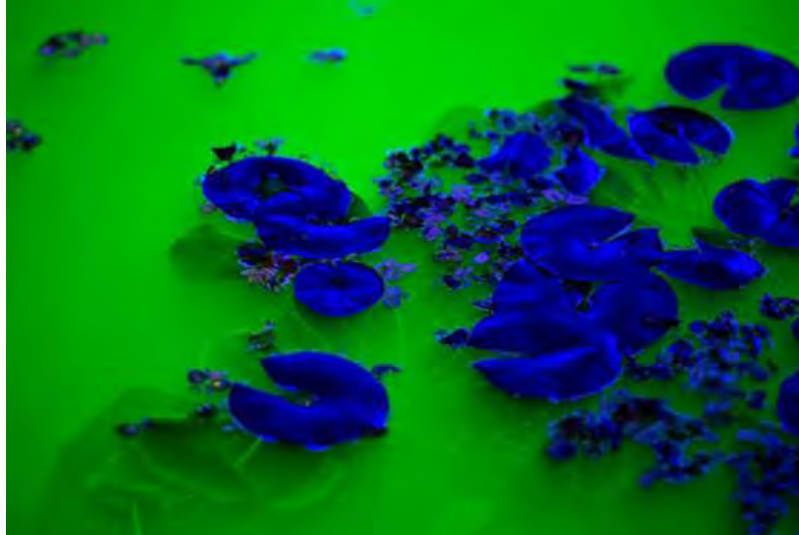
Detail of life , Olafur Eliasson

Ice Watch , un trabajo artístico que realicé con el geólogo Minik Rosing, en tres ocasiones en el espacio público, fue una invitación a que los transeúntes se involucraran con grandes bloques de agua vieja y congelada que se derretían gradualmente, mientras escuchaban el ruido del deshielo –que liberaba aire de miles de años–, tocaban y olían el hielo derretido.